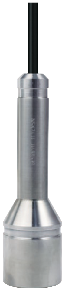
Гидростатические погружные уровнемеры NIVOPRESS NC