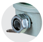
Самозажимной кабельный ввод

Модели SH1LR / SH2LR оснащены самозажимным кабельным вводом, а модели SH1TLR / SH2TLR оснащены ниппелем 15С на кабельном вводе.