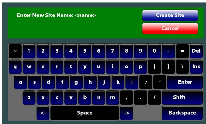
Полная экранная клавиатура

>300 объектов, сохраненных в памяти пользователя 1 гигабайт; загружается в USB "флешку".