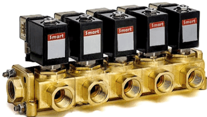
Клапаны электромагнитные серии SM8863_-K