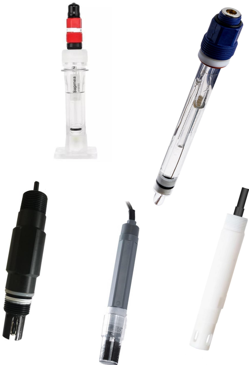
Электроды серии XSON-SUP-PH