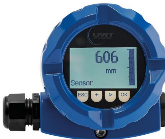
Рисунок 1 – Общий вид модуля индикации

Общий вид модуля индикации представлен на рисунке 1. Общий вид зондов представлен на рисунке 2. Пломбирование датчиков не предусмотрено. Серийный номер в виде цифрового обозначения, состоящего из арабских цифр, наносится типографским методом на табличку, приклеенную к корпусу модуля индикации или на табличку из нержавеющей стали, методом лазерной гравировки, в соответствии с рисунком 3. Конструкцией датчиков не предусмотрено нанесения знака поверки. Знак поверки наносится на свидетельство о поверке в соответствии с действующим законодательством. Конструкцией датчиков не предусмотрено нанесение знака утверждения типа.