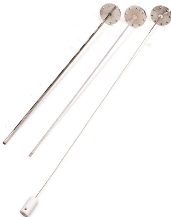
Рисунок 2 – Общий вид зондов