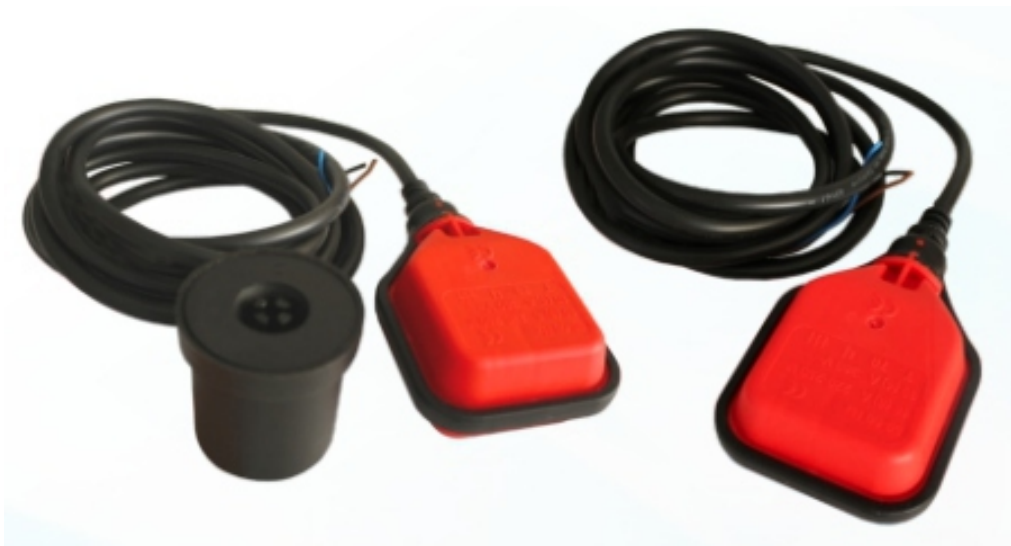
Датчик уровня поплавковый FTE