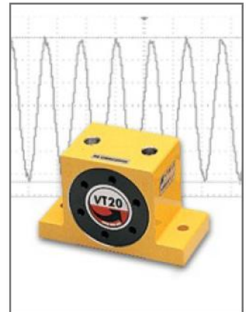
Макс. температура 100°C Макс. уровень шума 60-75дБ

Наилучший выбор, если требуется высокая частота вибраций при низком уровне шума. Обычно устанавливается на вибрационных сепараторах, конвейерах, машинах для расфасовки и упаковки, разливочных машинах и др.