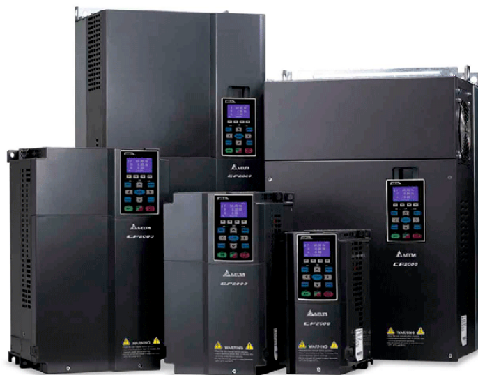
Современные промышленные преобразователи частоты

Двигатели с короткозамкнутым ротором с давних пор использовались исключительно в нерегулируемом электроприводе, так как возможность плавного регулирования скорости вращения двигателей не была в должной степени технически реализуема. Сейчас, благодаря достижениям микропроцессорной техники и электроники, ситуация кардинально поменялась, и частотно-регулируемый привод (ЧРП) стал основным типом регулируемого электропривода.