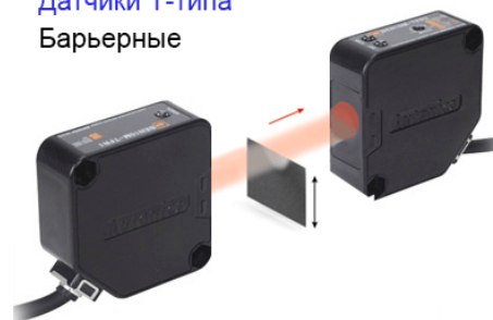
Датчики Т-типа Барьерные

Датчики Т-типа удобны для контроля непрозрачных или хорошо отражающих объектов, но могут давать неудовлетворительные результаты при обнаружении прозрачных объектов. Так как излучатель и приемник в датчиках данного типа конструктивно выполнены в разных корпусах, что позволяет установить максимальный коэффициент усиления, то их можно использовать в условиях высокой загрязненности рабочей среды. Максимальное расстояние между излучателем и приемником, так называемая зона срабатывания, может достигать 60 м.