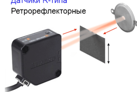
Датчики R-типа Ретрорефлекторные

Если на пути луча возникает объект, приемник формирует выходной сигнал. Обратная логика работы датчика может быть реализована путем установки отражателя на объекте, перемещение которого контролируется датчиком. Датчики данного типа еще называют рефлекторными. Рефлекторы, которые еще называют отражателями, катафотами или мишенями, приобретаются отдельно от датчиков. Рефлекторы могут иметь различную форму и размеры. Диапазон измерений рефлекторных датчиков положения обычно указывается при использовании конкретной модели отражателя.